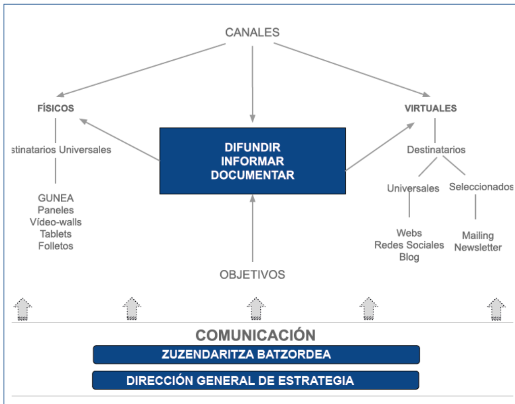
GRÁFICO III Comunicación de Etorkizuna Eraikiz Dinámicas

A través de estos tres soportes se cumple de manera generalista con los objetivos específicos del proceso de comunicación de Etorkizuna Eraikiz.